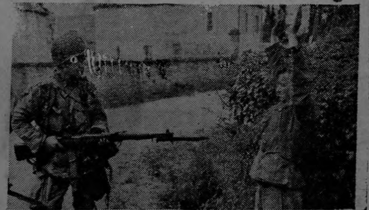
Con las manos en alto, un soldado alemán se rinde a un paracaidista del Ejército de los Estados Unidos, que le apunta con la bayoneta para impedir cualquier tentativa de escape. Más de 10.000 nazis se rindieron en la primera semana de la campaña que abrió una brecha en las defensas de la costa de Normandía y penetró algunos kilómetros tierra adentro. Esta fotografía, sacada en el mismo campo de batalla, fué despachada a Nueva York por avión.

7.000.00 Hombres en el Ejército E.E. U.U. 3.657.000 Hombres tiene Estados Unidos en Europa y a fines de año habrá cinco millones de americanos en ultramar