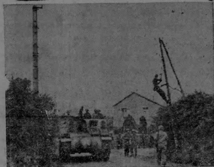
Mientras los electricistas del cuerpo de señales reparan las líneas de comunicaciones, los tanques del Ejército de los Estados Unidos avanzan en una carretera de Normandía. Esta fotografía fué transmitida por radio desde Londres a Washington.