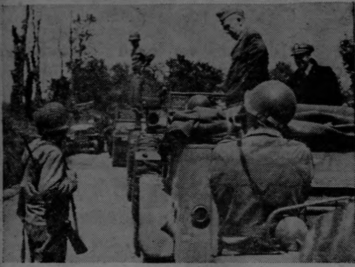
Aparece en esta fotografía el Gen. George C. Marshall, Jefe del Estado Mayor del Ejército de los Estados Unidos, en una carretera de Francia donde se detuvo para platicar con un soldado de infantería. El general Marshall visitó Normandía una semana después de que las tropas aliadas asaltaron las defensas costeras de los nazis. Esta fotografía fué radiada desde Londres a Washington.